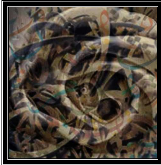
التصميم السابع الأبعاد ٥٠×٥٠ سم