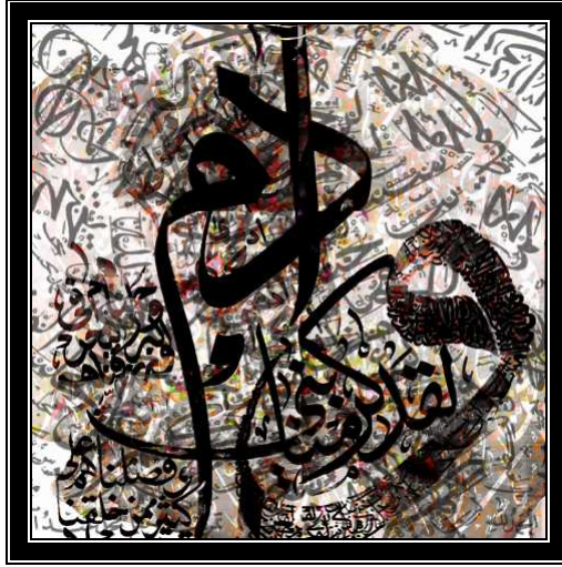
التصميم السادس الأبعاد ٥٠×٥٠ سم