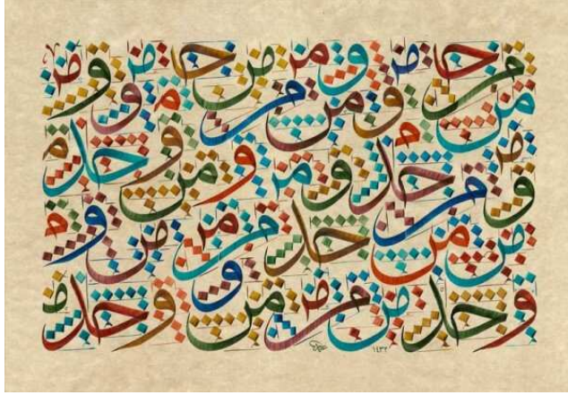
شكل (١) نموذج كرتة