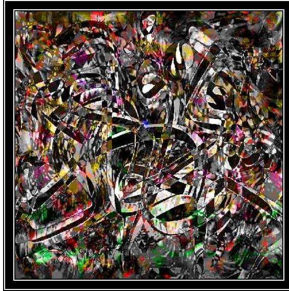
التصميم الحادى عشر